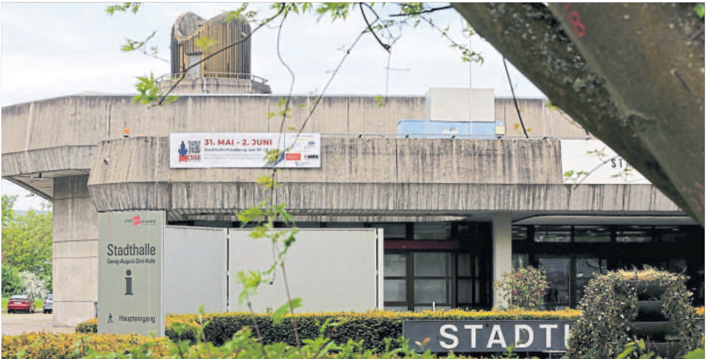
Die Messe Wetterau in und an der Stadthalle wird auch Schauplatz einer Jobbörse sein.