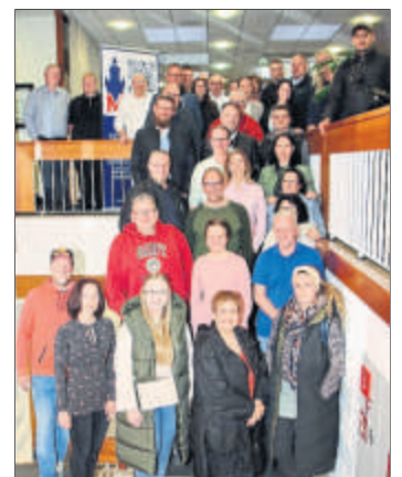
S. 12 Vorfreude auf die Messe. (lod)