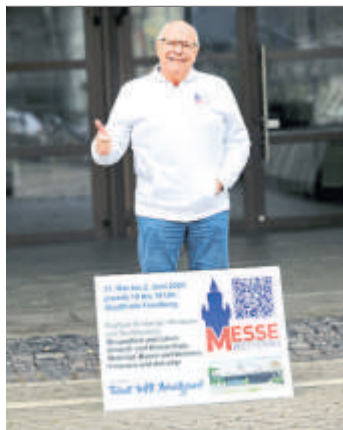
Daumen hoch für die Messe Wetterau.