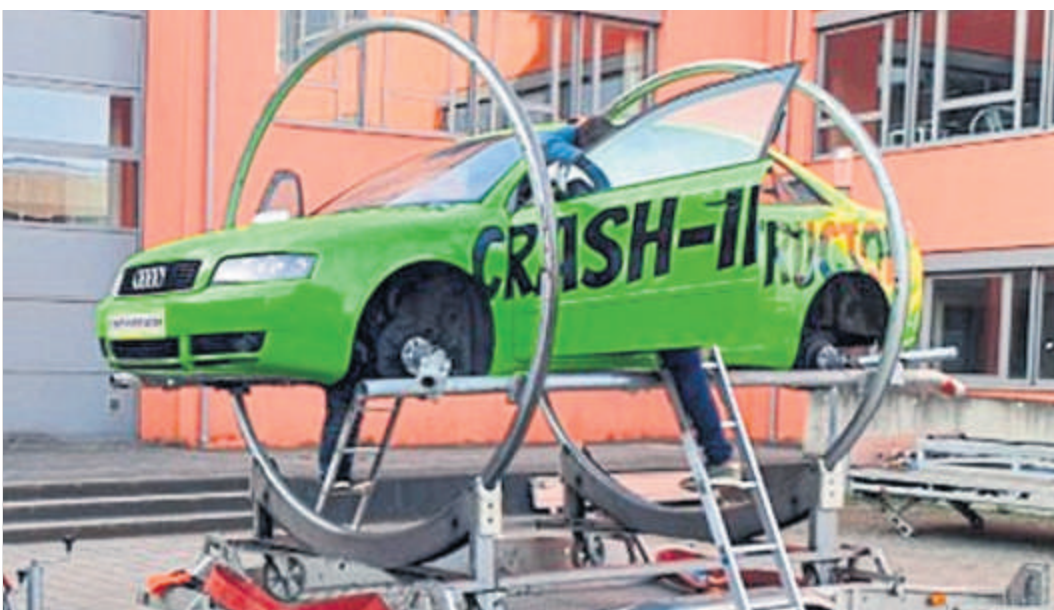
Attraktion: Der Überschlag-Simulator.