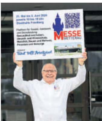
Herzlich willkommen zum Messe-Event.