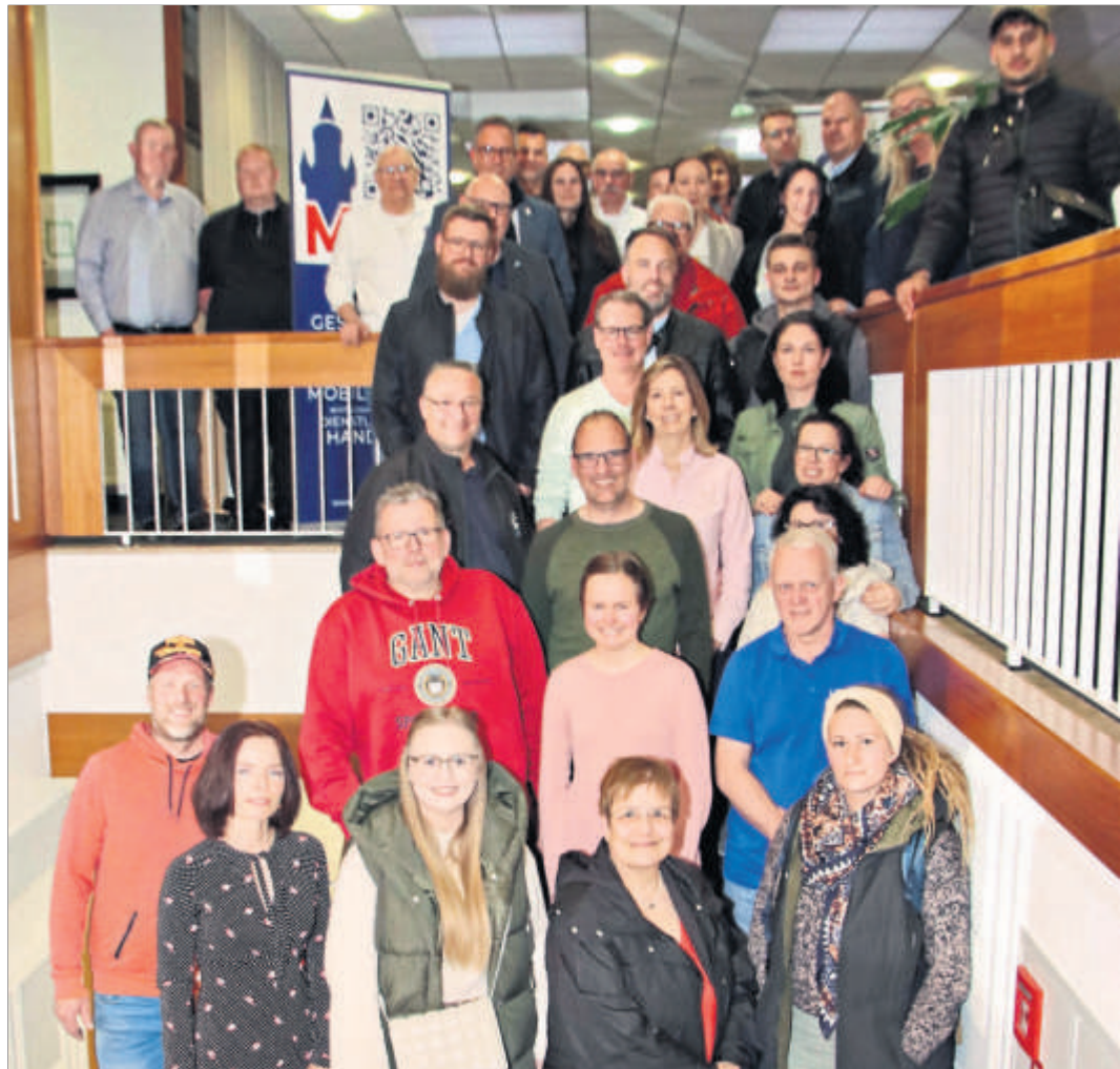
Die Aussteller und Messemacher freuen sich auf die 10. Messe Wetterau.