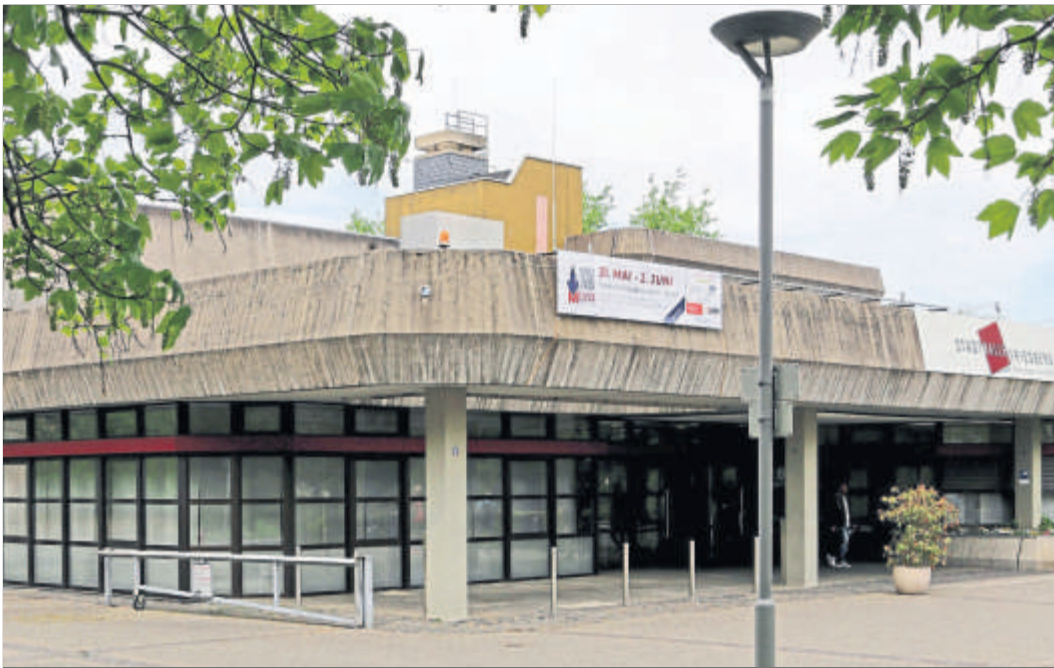
Die Stadthalle wird Schauplatz der Messe Wetterau – das Forum für die Wirtschaft in der Region. Eine Jobbörse ist integriert.