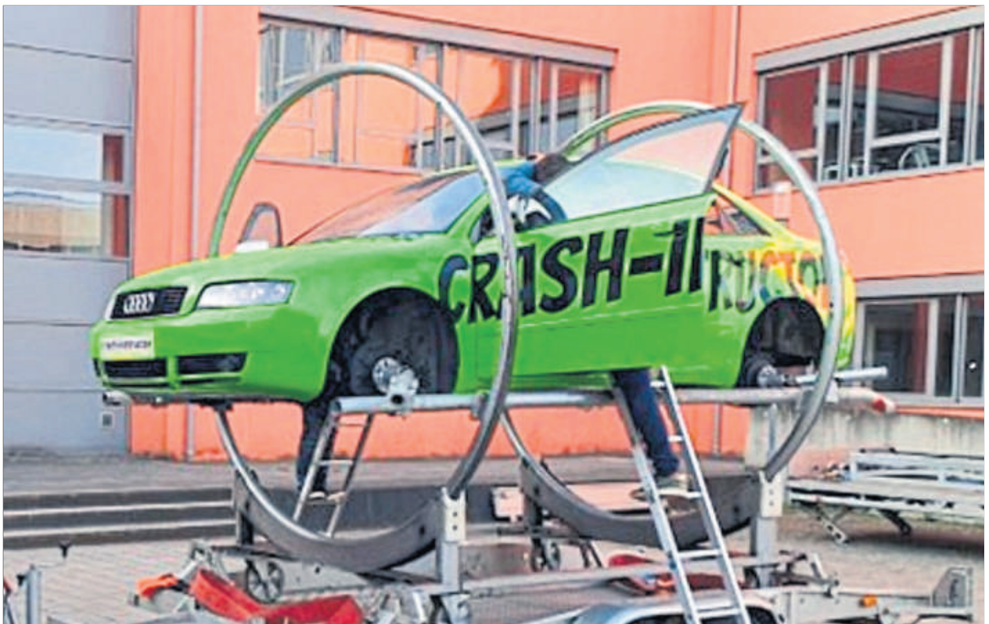
Ein handelsübliches Fahrzeug in einem Drehgestell simuliert einen Überschlag. Die Teilnehmer steigen in das normal stehende Kfz und werden angeschnallt, anschließend wird der Pkw im Drehgestell um 180 Grad gedreht und verriegelt. Unter Anleitung des Fachpersonals ist es dann Aufgabe der Teilnehmer, die Selbst- und Fremdrettung zum Beispiel als Ersthelfer aus dem Kfz zu üben.