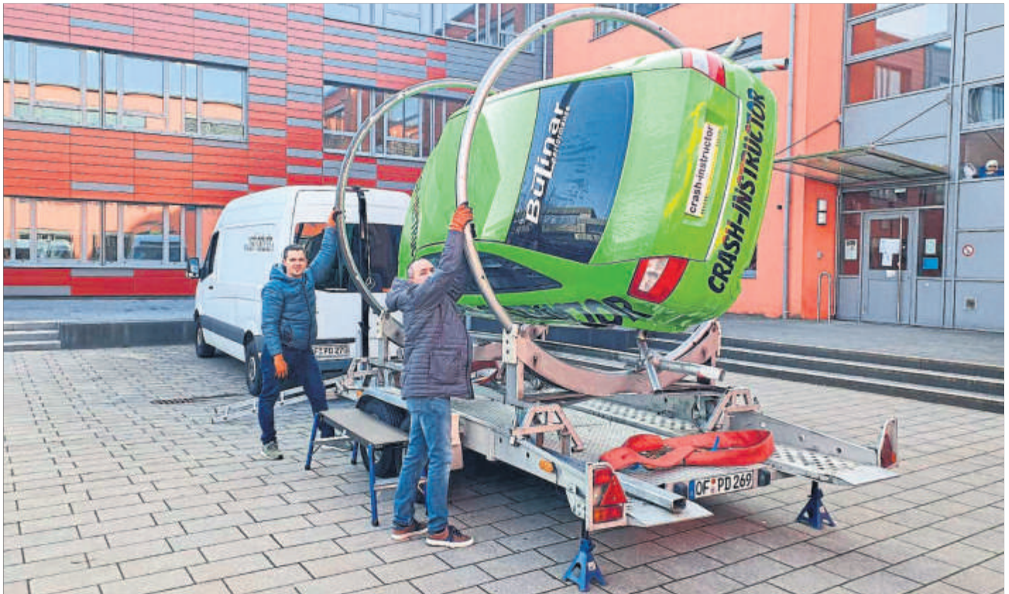
Eine Attraktion: Der Überschlag-Simulator für Stand A14, der nach den Worten von Messeorganisator Friedrich Wilhelm Durchdewald bestens zu den Fahrzeuganbietern passt.